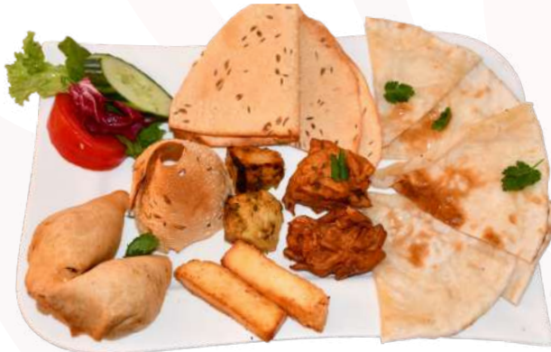
Mix Vorspeise für Zwei