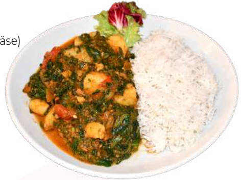
T2. Saag Aalu

T5 Lamm Saag 12,90 (Spinat mit Lamm-Curry)