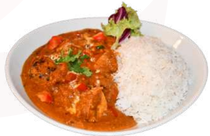
C2. Chicken Tikka Masala