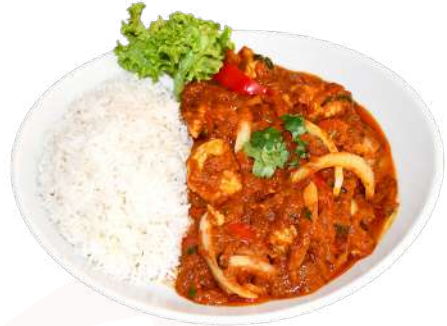
P2. Chicken Jalfrezi