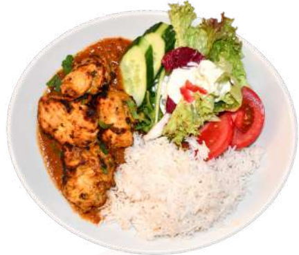
B1. Tandoori Chicken Tikka

B4 Grill Special 15,90 (Gambas, Lamm, Chicken mit Beilagen Teller)