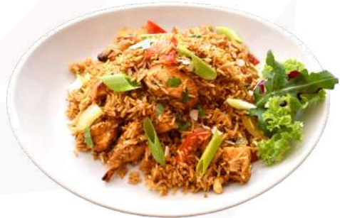
K1. Chicken Biryani