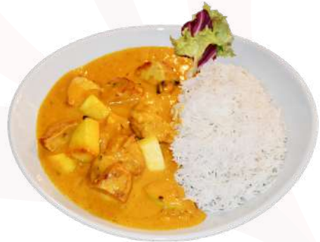
G2. Chicken Mango Curry