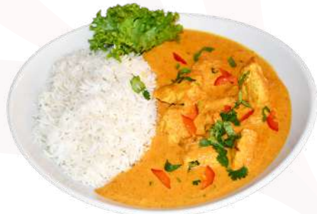
M2. Chicken Madras Curry