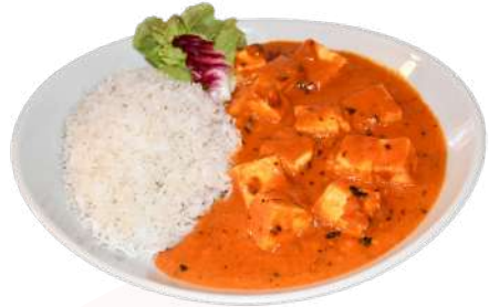
H1. Paneer Butter Masala