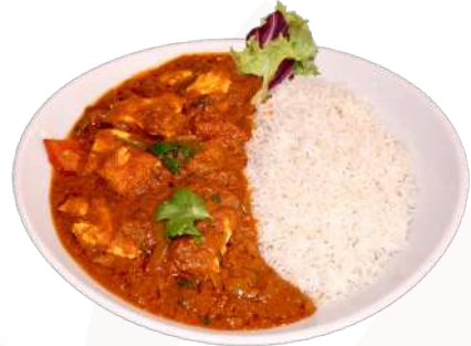
L1. Chicken Traditional Curry

L5 Gemüse Paneer 10,50 mit Hausgemachtem Käse