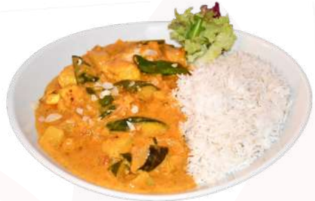
D5. Gemüse Korma