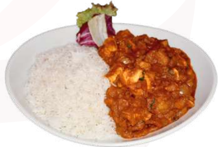
R2. Chicken Vindalu